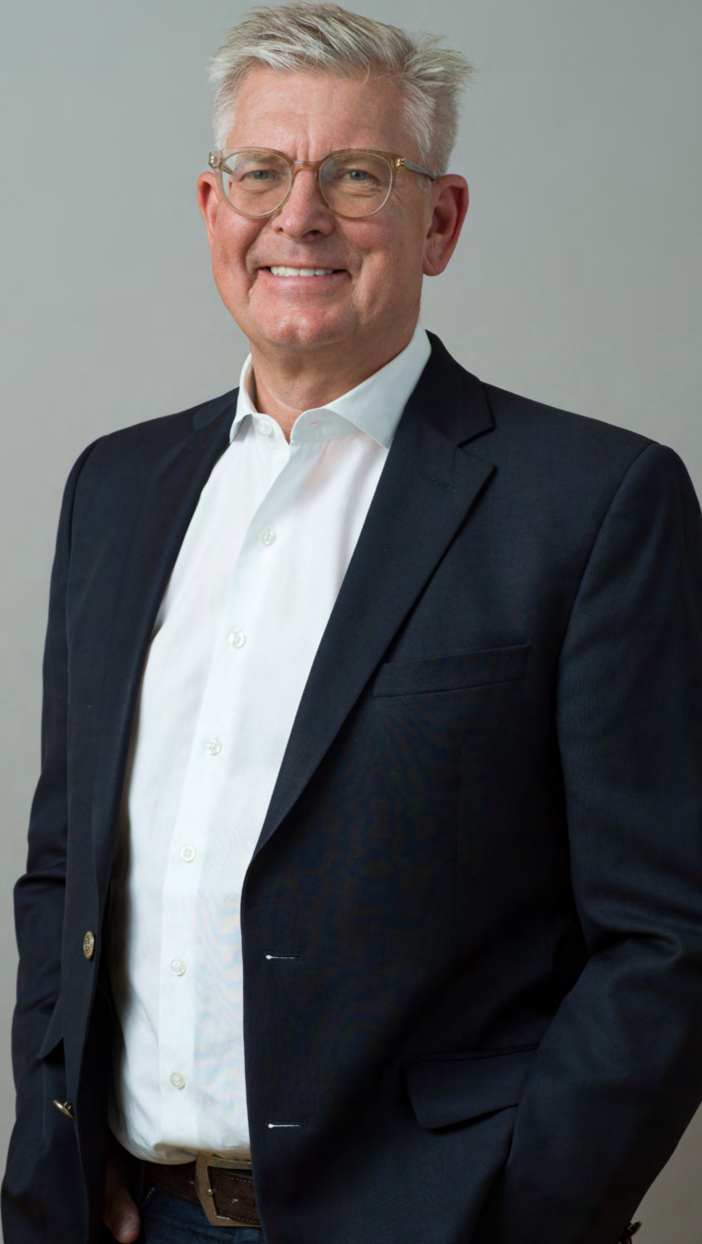
رئیس و مدیر عامل