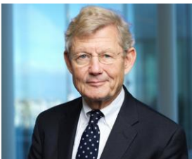
Jacob Wallenberg (invald 2011) Vice styrelseordförande

Verkställande direktör och koncernchef för AB Industrivärden sedan 2015. Delägare i riskkapitalbolaget IK Investment Partners (2008–2015), med ansvar för kontoret i Stockholm från 2011 till 2015. Investeringschef på IK Investment Partners (1998–2008). Tidigare erfarenhet som konsult för Bain & Company (1997–1998).