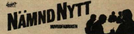
Andra kvartalets ordinarie sammanträde 1 juni 1972. Vid LME/HF får alla anställda del av nämndarbetet genom bladet NÄMNDNYTT.

Företagsnämndsverksamheten är en av formerna för samarbete vid LME. Antalet ordinarie ledamöter i nämnderna inom den svenska delen uppgår till omkring 500. Men vet Du hur många nämnder det finns inom moderbolaget och dotterbolagen tillsammans? Är det 21 skriv en 1:a, 36 blir ett X och 61 ger en 2:a!