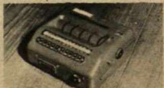
En enkel maskintyp för... ja vad då?

Kallas det maskinerna åstadkommer för 1 = kryptering, X = simultering eller 2 = banalisering?