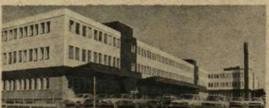
I Sättra har televerket och LME ett utvecklingsbolag.

Ett fruktbarande samarbete med staten sker i ett sk utvecklingsbolag som ägs gemensamt av televerket och LME. Ett beslut har nyligen fattats att till bolaget förlägga utvecklingen av ett datorstyrt system för lokalstationer. Det blir bolagets hittills största arbetsuppgift. Heter bolaget: 1 = INTELSA, X = ELLEMTTEL, 2 = TELEMET?