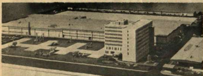
Modell av ny LME-fabrik. I vilket land byggs den?