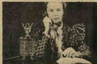
När kom "kaffekvarnen" ut på marknaden?

Under årens lopp har LME tillverkat ett otal olika telefonmodeller. Den här avbildade kallas ofta för "kaffekvarnen" och är fantasifullt metalldekorerad och blev kanske just därför speciellt populär i Orienten. När kom den ut på marknaden? 1889 = 1, 1893 = X, 1898 = 2.