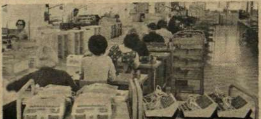
Dirivox (t v) och Centrum snabbtelefoner klara för leverans. I vilken LME-fabrik i Sverige?

Dotterbolaget LM Ericsson Telemateriel AB med huvudkontor i Bollnora utanför Stockholm och med säljkontor över hela landet marknadsför bl a olika typer snabbtelefoner för interna telekommunikationer inom t ex kontor, industrier, skolor och sjukhus. En viss LME-fabrik i landet plockar ihop de olika delarna till färdiga apparater. Bilden visar leveransklara snabbtelefoner typ Dirivox (t v) och Centrum i den fabrik som vi vill veta var den ligger. 1 för Kristianstad, X för Norrköping, 2 för Oskarshamn.