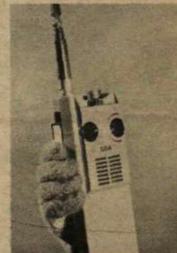
"Walkie talkie" är en stor SRA-produkt. En annan betydelsefull är...?

Dotterbolaget Svenska Radio AB i Stockholm med verksamhet även i Solna, Bromma och Kumla är mest känd för sina mobilradioutrustningar. Bl a polisen, taxi, skogsbrukets transportfordon, små och stora fartyg använder sig av olika typer sådan utrustning. Men man har andra viktiga produkter i sitt varusortiment. T ex — ja, vad då? Sätt 1 för personsökare, X för gatusignalsystem och 2 för brandalarmsystem!