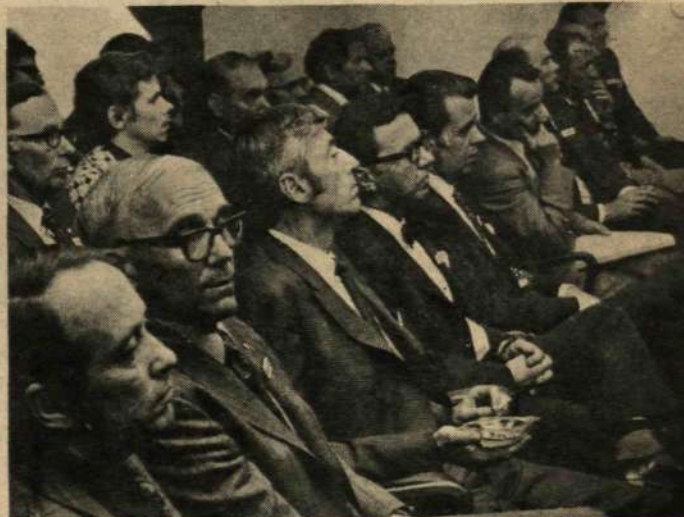
Nämnddeltagare vid sammanträdet som hölls i Hudiksvall Stads-hotells konferenslokaler.