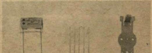
Kondensatorn MINIPRINT från RIFA känns väl igen?

AB Rifa med verksamhet i Bromma, Bollnora, Kalmar och Gränna är koncernens specialist på kondensatorer — en dylik kallad Miniprint finns med på nedanstående bild. Tror Du att Miniprint är prylen längst till vänster skriv 1, X om det är den i mitten och 2 om Du tror på den till höger!