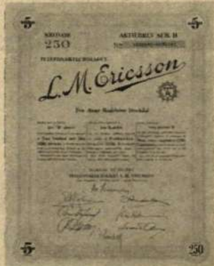
Ett aktiebrev LME serie B på 5 aktier à 50 kronor.

Antalet aktieägare inom koncernen rör sig om 104 000. Aktiekapitalet hos moderbolaget består av drygt 12,3 miljoner aktier à 50 kronor styck. Hur stor procent av aktieantalet finns i svenska händer? Sätt 1 för ca 52 procent, X för ca 69 procent och 2 för ca 78 procent!