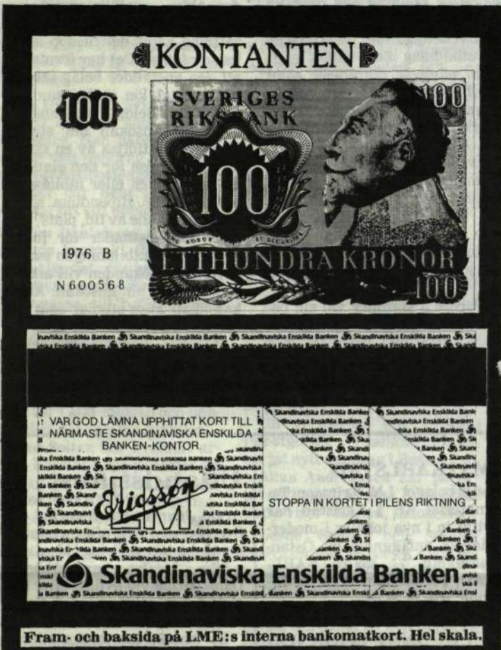
Fram- och baksida på LME:s interna bankomatkort. Hel skala.

INFORMATIONSTIDNING FÖR LM ERICSSON MED DOTTERBOLAG