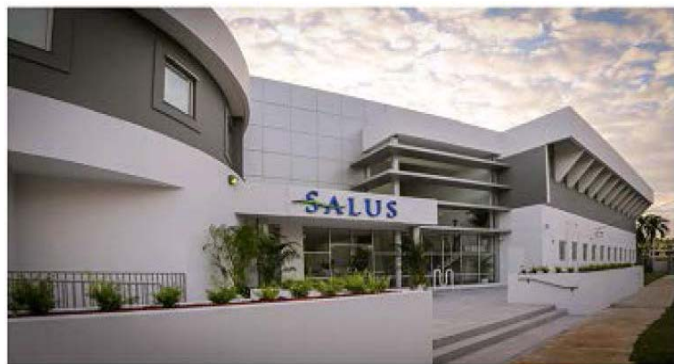
Hospital Salus, Puerto Rico