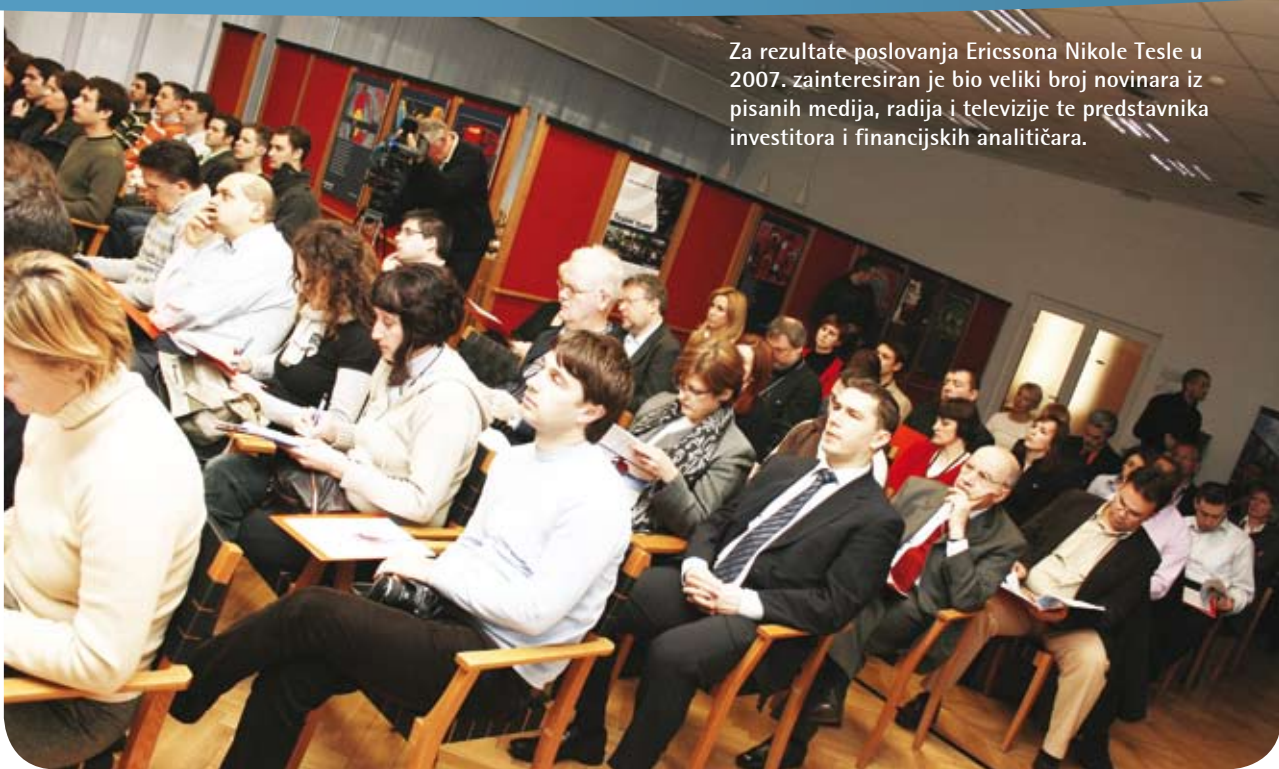
Za rezultate poslovanja Ericssona Nikole Tesle u 2007. zainteresiran je bio veliki broj novinara iz pisanih medija, radija i televizije te predstavnika investitora i finansijskih analitičara.